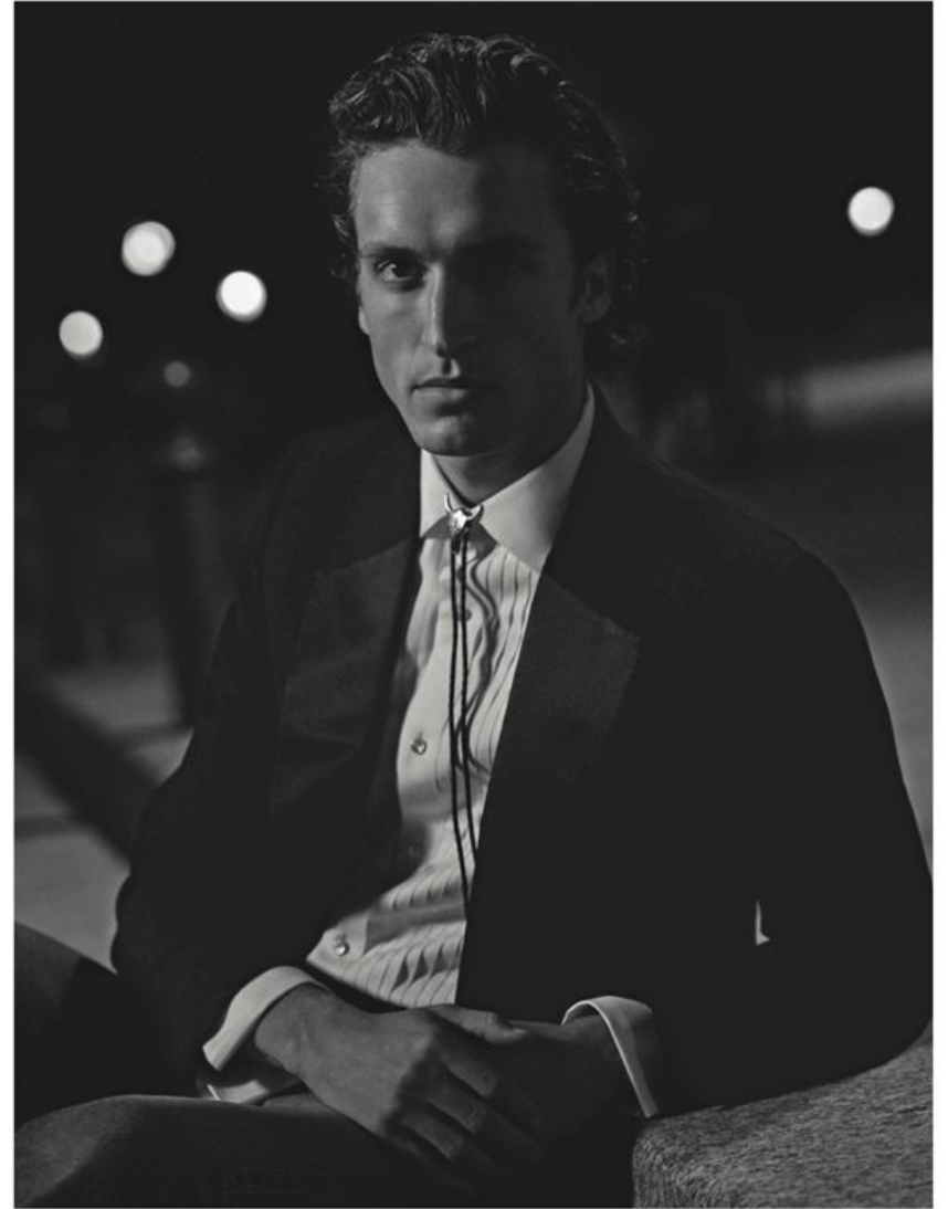
Giacca tuxedo con revers in raso e camicia con plastron, Ermenegildo Zegna XXX ; jeans, Celine . Nella pagina a fianco: abito in cotone e camicia, N°21 ; canotta, Celine ; cappello, Stetson ; camperos, Sendra .