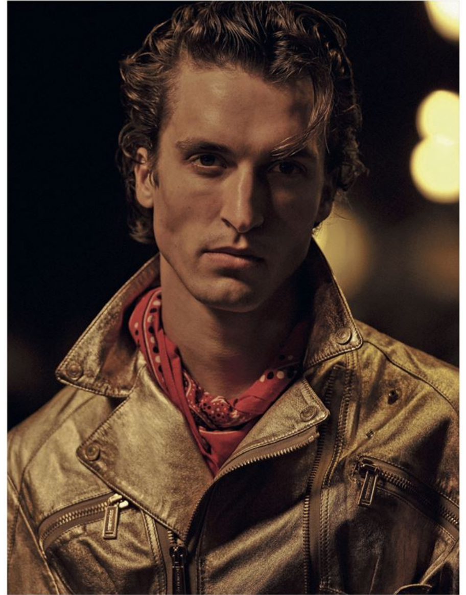
Chiodo in pelle e bandana, Dsquared² . Nella pagina a fianco: giubbotto con tasche applicate, camicia e pantaloni, Ami ; cappello, Stetson .

N° 1/2 gennaio-febbraio - Poste Italiane SpA - Sped. in a.p. - D.L. 353/03 conv. in L. 46/04, art. 1, comma 1, DCB Milano. € 3,50 + più il prezzo del Corriere della Sera.