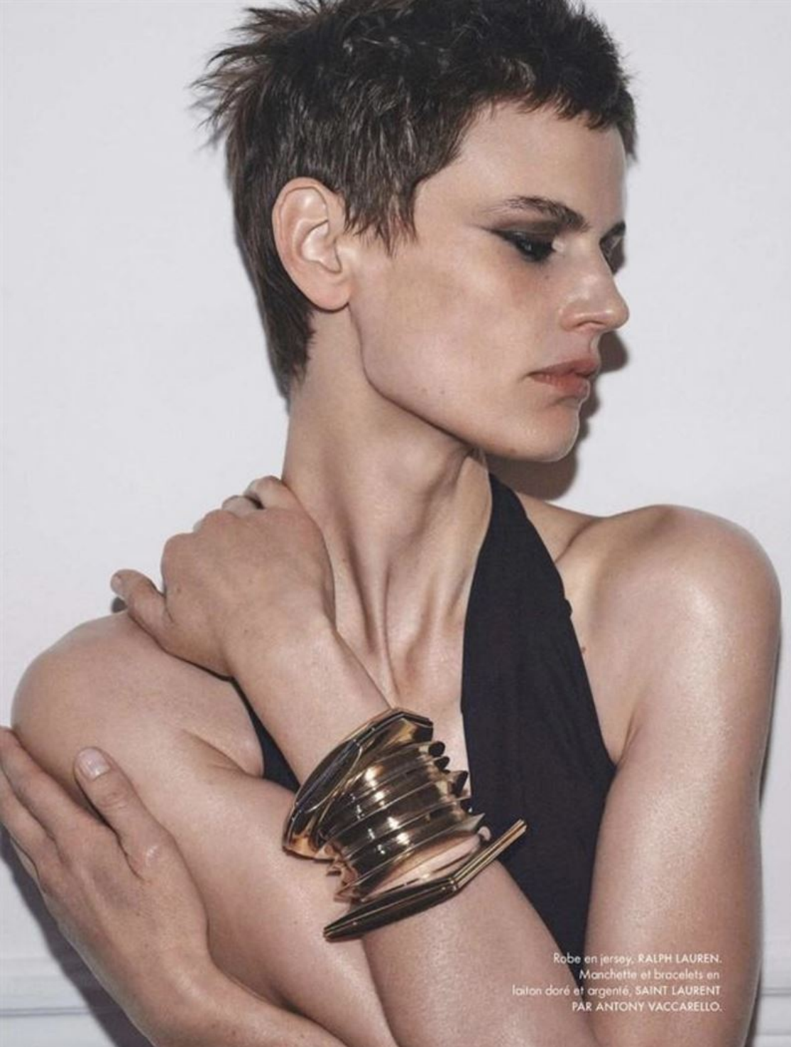
Robe en jersey, RALPH LAUREN. Manchette et bracelets en laiton doré et argenté, SAINT LAURENT PAR ANTONY VACCARELLO.