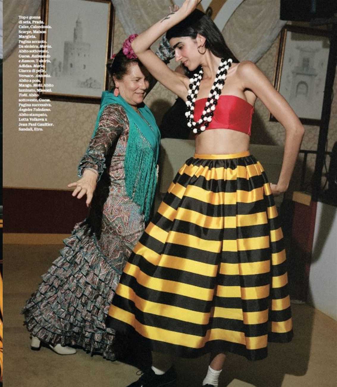
Top e gonna di seta, Prada. Calze, Calzedonia. Scarpe, Maison Margiela. Pagina accanto. Da sinistra, Maria. Abito sottoveste, Guess, Raimondo e Ramon, T-shirts, Adidas, Maria. Giacca di pelle, Versace, Armani. Abito a polo, Mango, Molt. Abito laminato, Mosconi. Totti. Abito sottoveste, Guess. Pagina successiva. Ángeles Toledoano. Abito stampato, Lotta Volkova x Jean Paul Gaultier. Sandali, Etro.