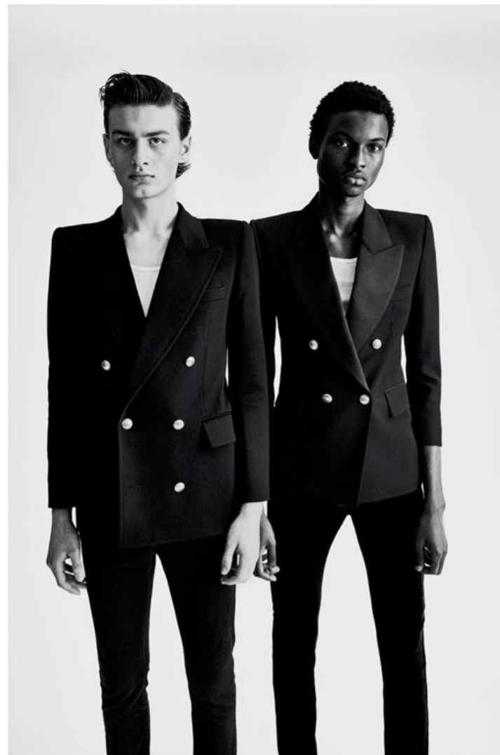
Blazers en gabardine de coton, débardeurs et jeans, SAINT LAURENT PAR ANTHONY VACCARELLO .