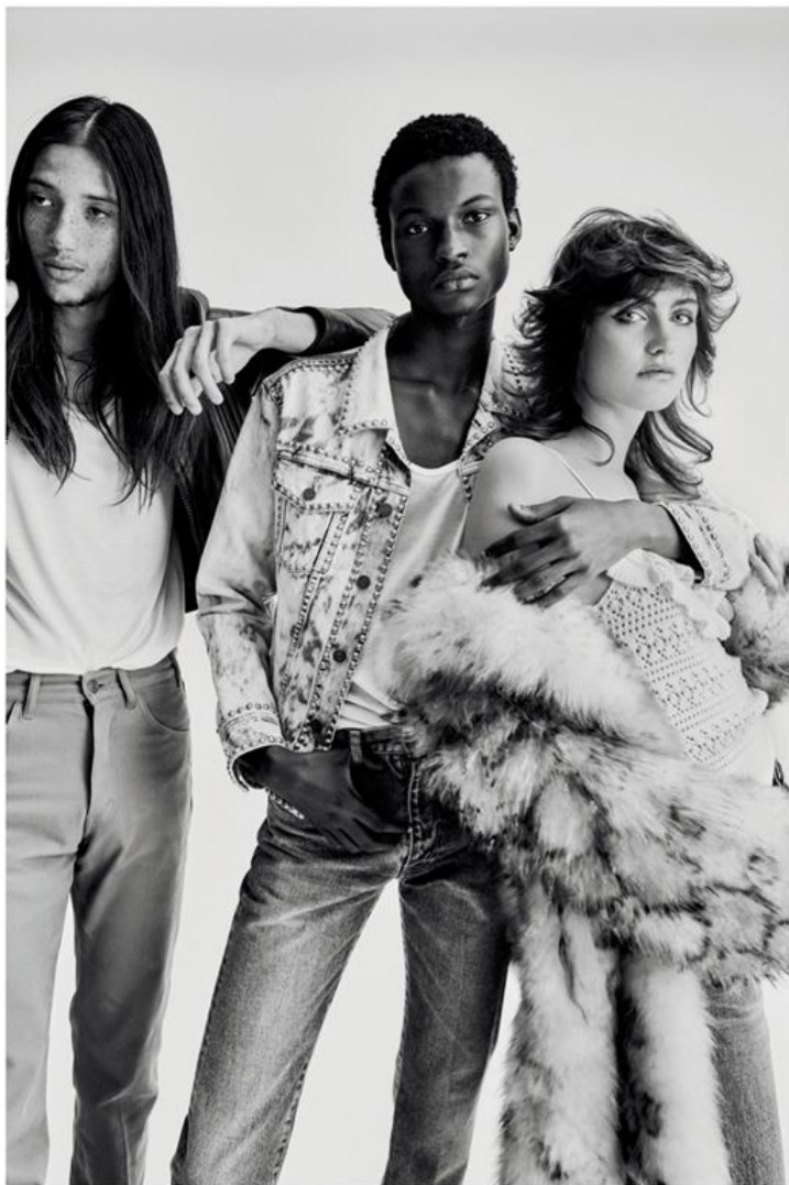
À gauche : blouson en cuir, débardeur en coton et pantalon en toile, CELINE PAR HEDI SLIMANE . Au centre : veste en denim, débardeur en coton et jean, CELINE PAR HEDI SLIMANE . À droite : manteau en fourrure, débardeur en maille crochétée et jean, CELINE PAR HEDI SLIMANE .